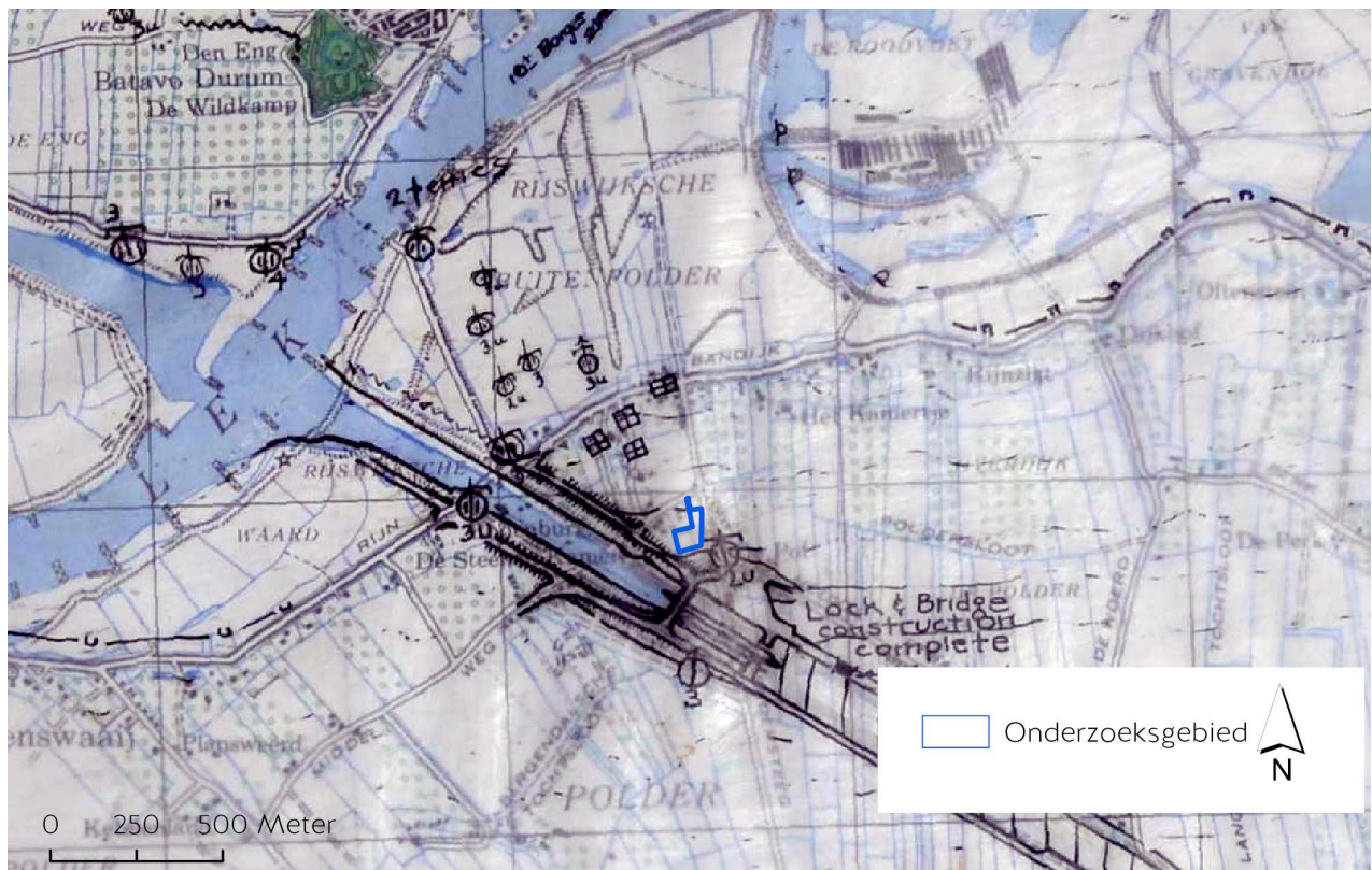
Figuur 4 Library and Archives Canada, Defense overprints, sheet 2922

Rijswijk is tijdens de algehele bevrijding van Nederland bevrijd op 5 mei 1945. Op dat moment lag de dichtstbijzijnde frontlinie in het zuiden net ten zuiden van de Waal, bij de plaats Wamel, op 11 kilometer afstand van het onderzoeksgebied. In het oosten lag de frontlinie tussen Wageningen en Rhenen, wat ligt op 16,5 kilometer afstand van het onderzoeksgebied. 9 Derhalve levert de bevrijding geen indicaties op voor oorlogshandelingen in het onderzoeksgebied.