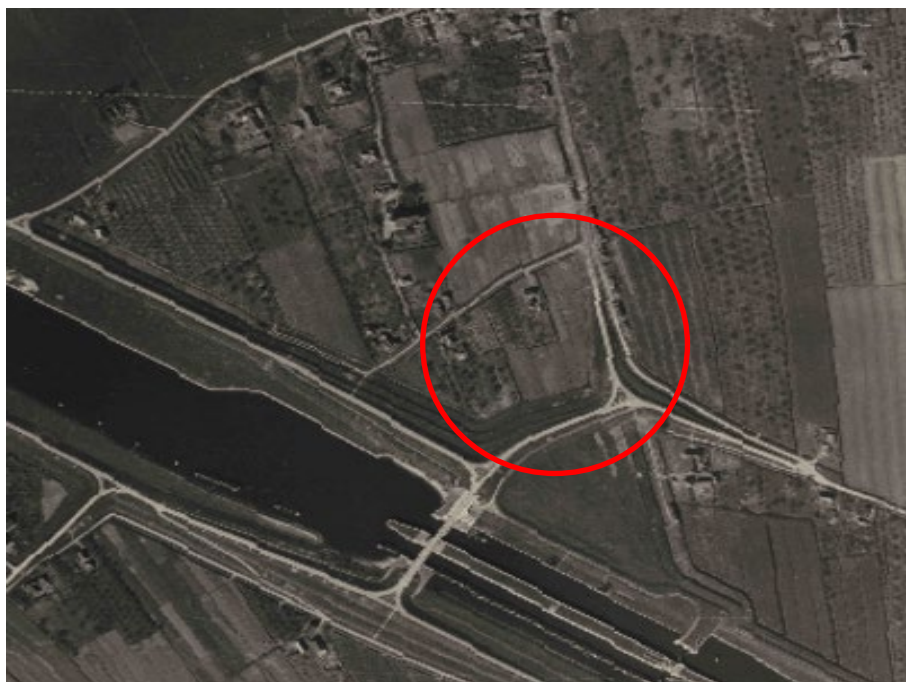
Figuur 3 Onderzoeksgebied op luchtfoto van 8 april 1945 (Sortiernr. R4-2203, luchtfotonr. 4174)

Uit dit rapport komt een bomafworp naar voren die is gemeld bij de kanaalbrug op 29 juli 1940. De burgemeester van Maurik rapporteerde dat op 29 juli 1940 in de buurt van de Kanaalbrug te Rijswijk twee bommen werden afgeworpen, waardoor woningen beschadigd raakten. Eén bom zou onder de voorgevel van een dubbele woning zijn geschoten en niet zijn ontploft. Deze blindganger zou zijn ingeslagen bij een rij 'dubbele arbeiderswoningen'. Expload heeft via Wageningen GeoPortal 1 een luchtfoto geraadpleegd van 8 april 1945 om te zien of dit type woningen ten tijde van de oorlog aanwezig waren in het onderzoeksgebied. Het onderzoeksgebied is op figuur 1 weergegeven in de rode cirkel. Op de luchtfoto zijn geen woningen in het onderzoeksgebied zichtbaar ten tijde van de oorlog. Zodoende zijn er geen indicaties dat dit bombardement in het onderzoeksgebied heeft plaatsgevonden.