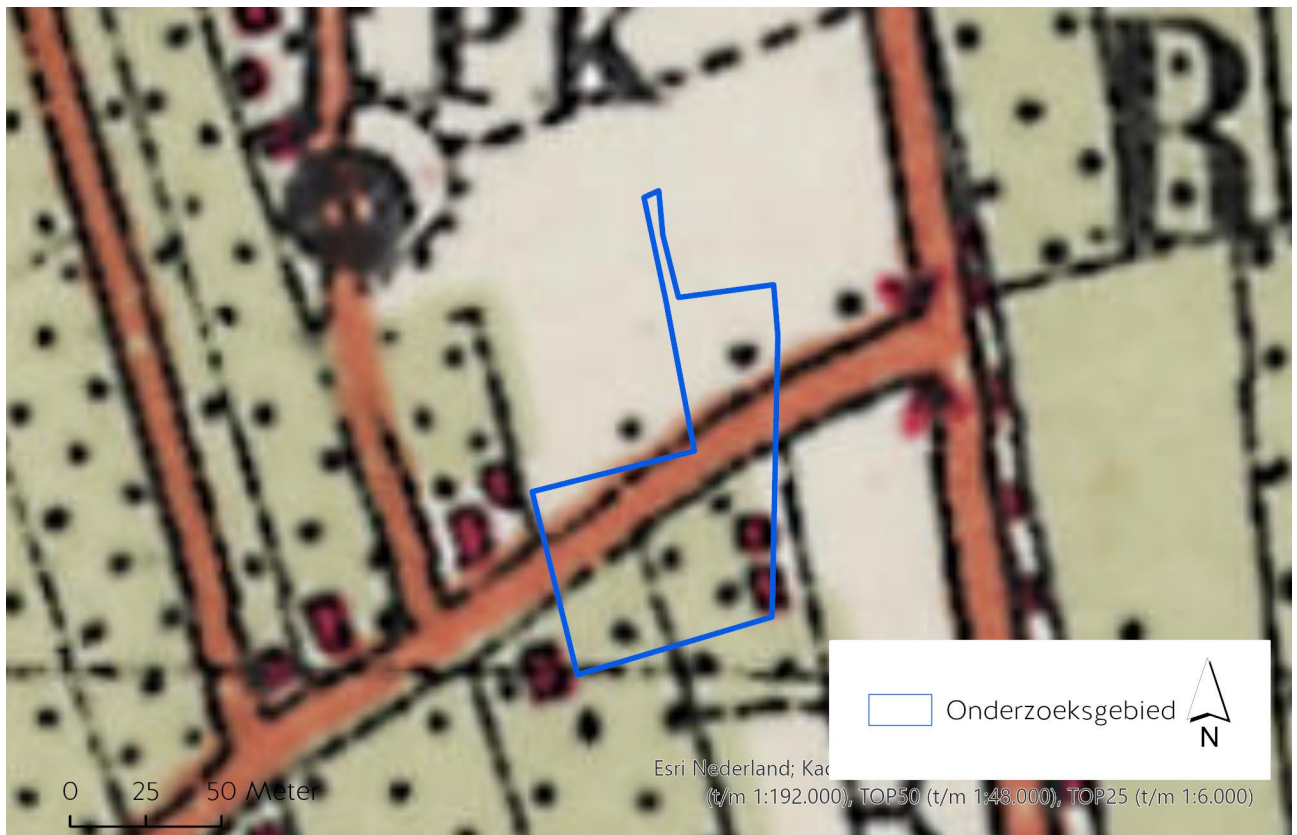
Figuur 2 Onderzoeksgebied op een historische topografische kaart uit 1955. Deze situatie komt overeen met de situatie WO-II